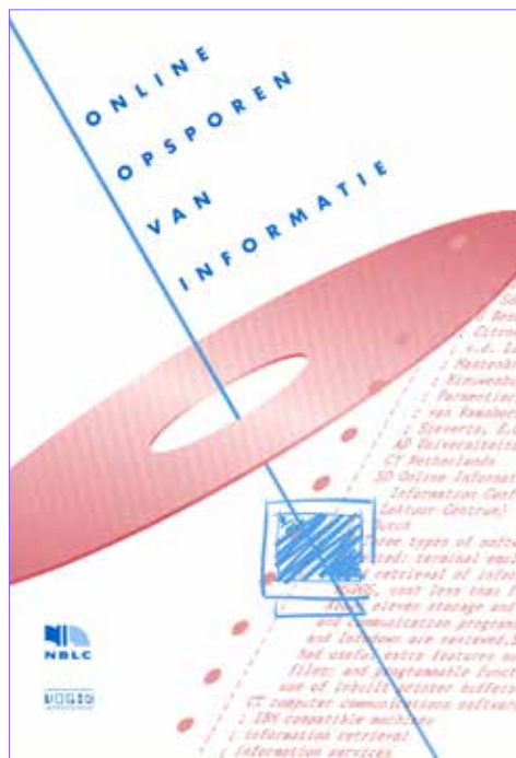
Omslag laatste editie cursusboek, 6 e herziene druk, 1996