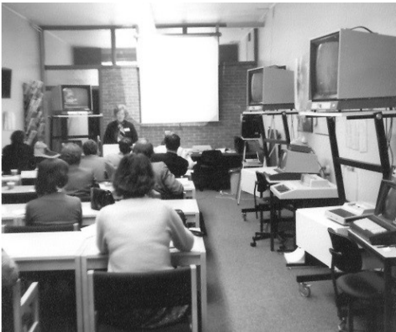
SOVIN-cursusruimte, Boothstraat 3, Utrecht