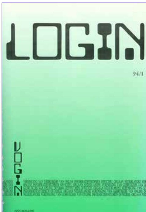
Omslag Login 94/1

Inmiddels was al besloten dat er een nieuwsbrief moest komen voor uitwisseling van informatie en ervaringen op het gebied van online literatuuronderzoek en het eerste nummer daarvan verscheen, nog voor de officiële oprichting van VOGIN, in oktober 1977 als Login , zes pagina's dik, met als ondertitel Nieuwsbrief van de online gebruikersgroep in Nederland .